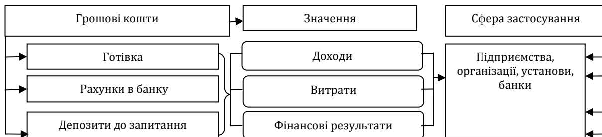
Рис. 1. Тракткування поняття «грошові кошти» і сфера їх застосування

Отже, на нашу думку, грошовий потік з точки зору обліку – це налагоджений, послідовний процес надходження і вибуття грошових коштів в готівковій та безготівковій формі, що підлягає документальному оформленню (у прибуткових і видаткових касових ордерах, платіжних дорученнях, інших платіжних документів, Звіті про рух грошових коштів) і належному руху документів.