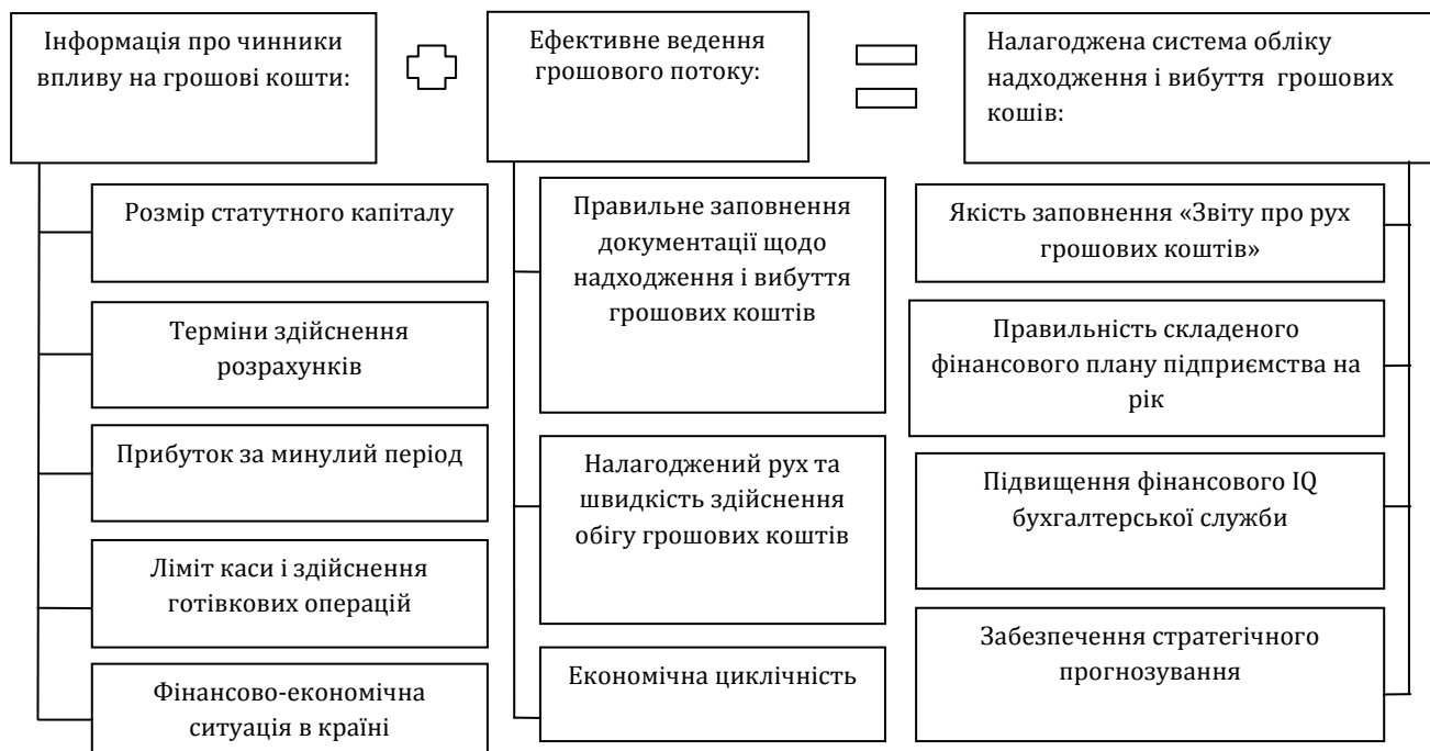
Рис. 3. Налагоджена система обліку надходження і вибуття грошових коштів

Інформація про грошові кошти є лише первинним джерелом, а щоб забезпечити подальший розвиток підприємства необхідно зважати на їх рух, і тут з'являються не що інше, як грошові потоки. Для ефективного ведення грошового потоку потрібно враховувати наступні аспекти: правильність заповнення та повнота складання первинної документації і контроль за нею, налагодженість руху грошей, економічну